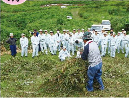
草刈り作業の意義などをパネルを使ってお話した後、農家さんから草の束ね方を教わりました。