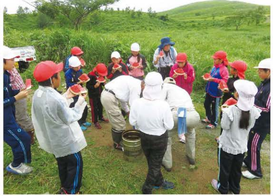
スイカの差し入れ。たくさんお代わりしてくれる人も。 このスイカの敷きものにも秋吉台の草は使われています。