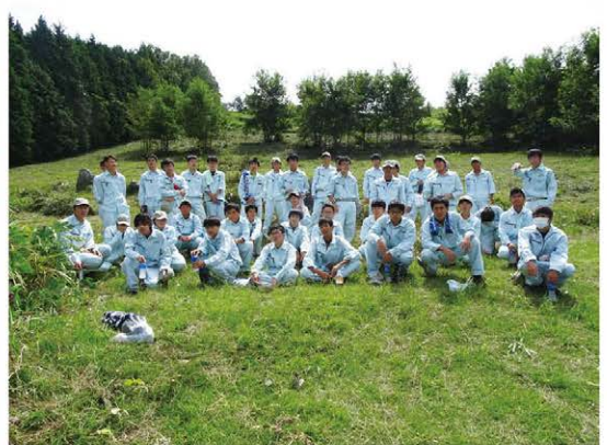
広い面積の刈り草が短時間で片付きました。今回の草は2軒の農家さんが利用しました。地元の伝統的な農業への応援をありがとうございました。