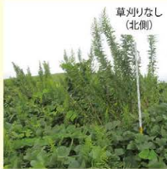
クズやネナシカズラのヤブの間からセイタカアワダチソウの太い茎がニョッキリと生えていました。その丈は2.5mもありました。