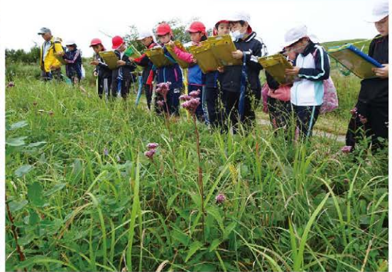
7月の草刈り跡では例年以上に花がたくさん咲きました。 どんなものが咲いたか、熱心に観察していました。