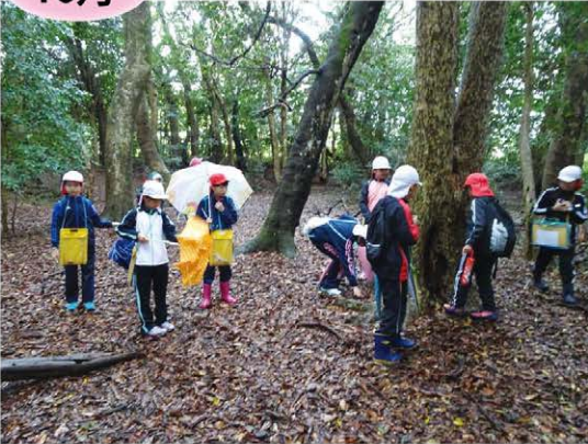
長者ヶ森にて。森の中では雨も気になりません。 カゴノキの樹皮パズルはなぜか子どもたちの方が上手。