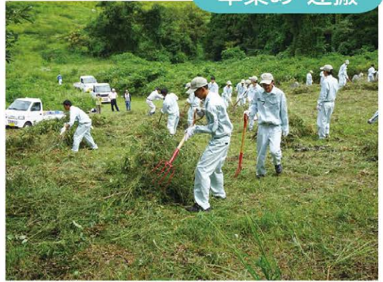
さすが高校生。前日に先生方が刈られた草をどんどんまとめていきます。とても大きな束を作る生徒さんも。