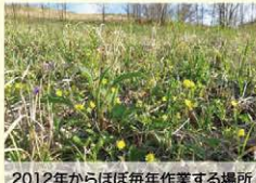
2012年からほぼ毎年作業する場所

初秋の草刈りでは秋のお花畑はできませんが、次の年の春はたくさんのお花が咲きます。高校生の草刈り跡地では採草地に多い花たちが咲いていました。