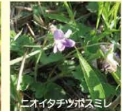
ヒオキチツボスミレ