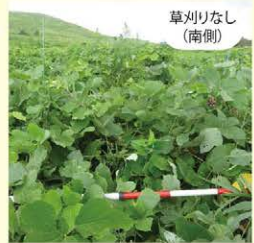
クズやネナシカズラ、カナムグラなどが覆いかぶさっていて、その下は暗く、植物の種類は非常に少ない状態でした。セイタカアワダチソウは少ないですが草原の植生とは全く違っていました。

2 セイタカアワダチソウの植物体の量は刈った草を持ち出す区域と草刈りをしない区域では減っていました。一方、ネザサやススキの量は刈った草を持ち出す区域で順調に増えていました。