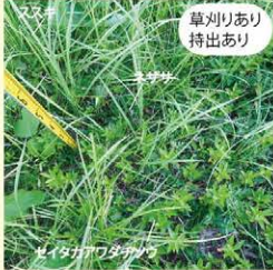
セイタカアワダチソウ(黄緑色)もありますが、ネザサ(濃い緑色)やススキ(細長い葉)がどんどん増えていました。

1 刈った草を持ち出す区域では、セイタカアワダチソウの占める割合が減ってきました。代わりにネザサや、特にススキの株が目立つようになりました。刈った草を放置する区域に生えるのはほとんどがセイタカアワダチソウでした。