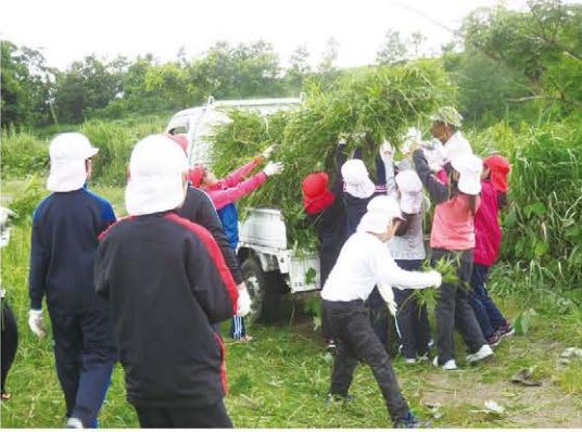
束ねた草は軽トラックの荷台に積み込みました。 刈ったばかりの草は重いのでみんなで力を合わせました。