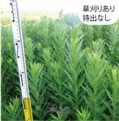
セイタカアワダチソウの茎は細めですが、密度が高く、他の植物はあまりみられません。草丈は1m以上ありました。