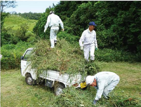
先生の指示のもと、軽トラに束を積み込んでいきます。あっという間にいっぱいになり、農家さんは畑との往復です。