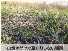
山焼きだけで草刈りしない場所